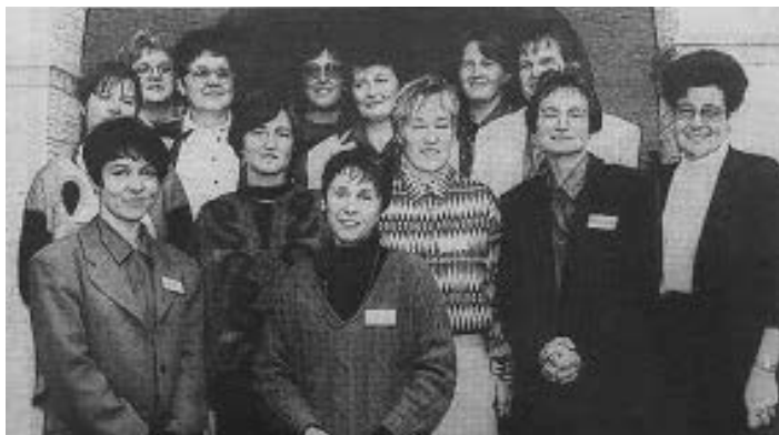
Der Vorstand im Jubiläumsjahr 1993