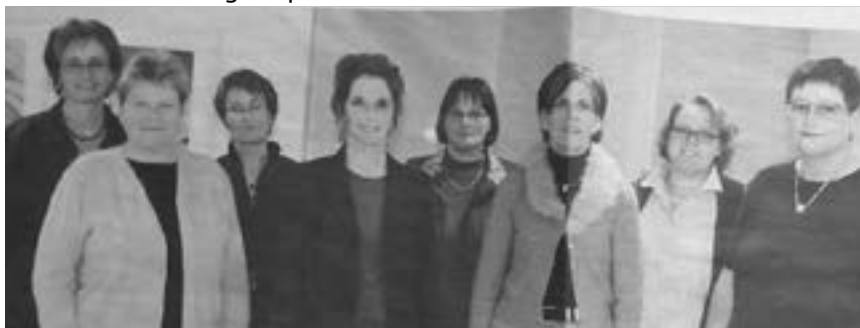
Der Vorstand 2003 von links:

Zum 60-jährigen Bestehen organisierte eine Arbeitsgruppe des Vorstandes einen Frauenkulturtag. In verschiedenen Ateliers präsentierten Urner Künstlerinnen ihre geschickten Handfertigkeiten oder anderen Talente. Die Palette reichte von Malen, Töpfern, Textilkunst bis hin zur Lyrik und Tanz. Abgerundet wurde der Abend mit einem kulinarischen Buffet mit einheimischen und auswärtigen Spezialitäten.